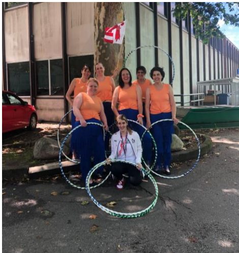
Sport-Gym Courtételle catégorie Dames