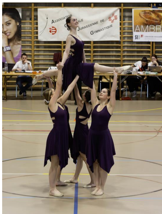
Team Actives - Créa'Move Delémont

En teams, c'est la société Fémina-Club Develier qui montait sur les plus hautes marches des podiums en Minis et en Actives et la FSG Courroux-Courcelon en Cracks.