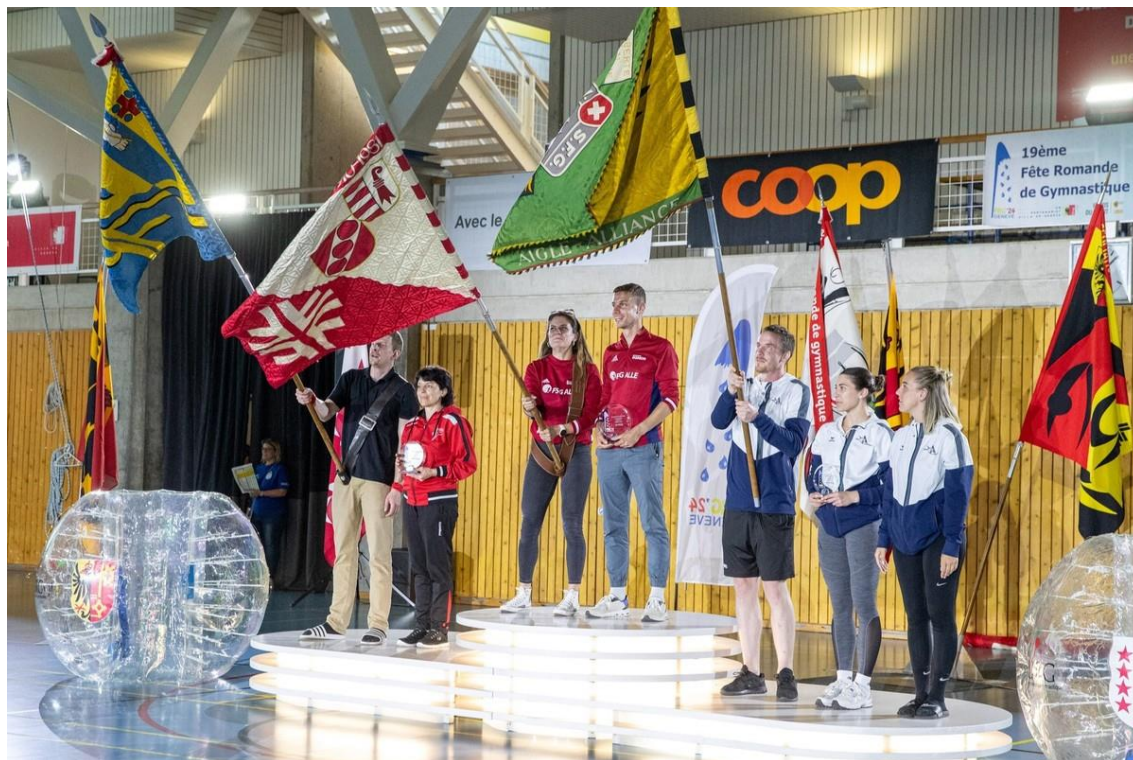
FSG Alle, première place du concours en 3 parties

La FSG Alle a brillé en terre genevoise avec une magnifique et très méritée première place pour le Concours en 3 parties dans la catégorie Active, ainsi qu'une première, deuxième et quatrième place pour l'Estafette-navette en catégorie adulte. Quelques regrets : le public peu nombreux et le côté « fête » clairement absent autour des terrains pour profiter au maximum de ces superbes prestations.