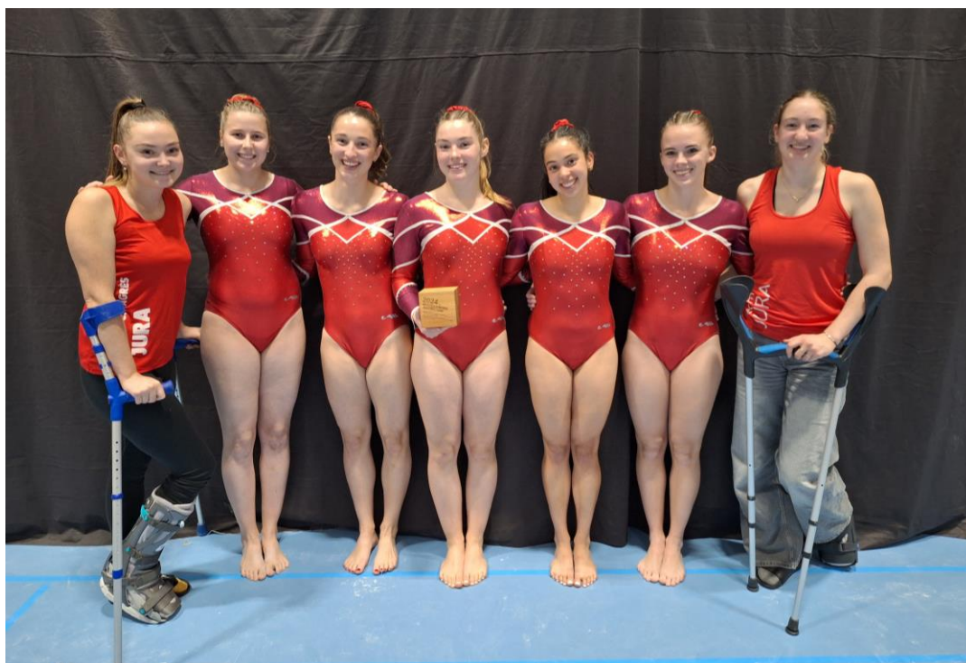
Equipe jurassienne – Catégorie 7

Même si le podium leur échappe cette année, le concours était d'excellente facture et un beau 5e rang vient les féliciter de leur persévérance.