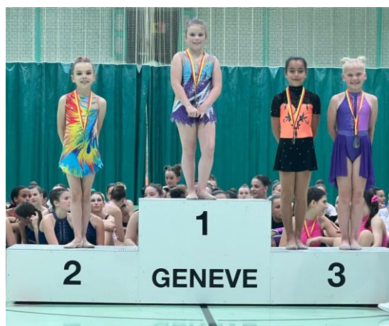
Podium gym individuelle - jusqu'à 12 ans