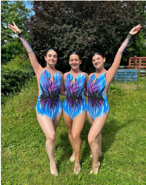
Team Actives de Fémina-Club Develier