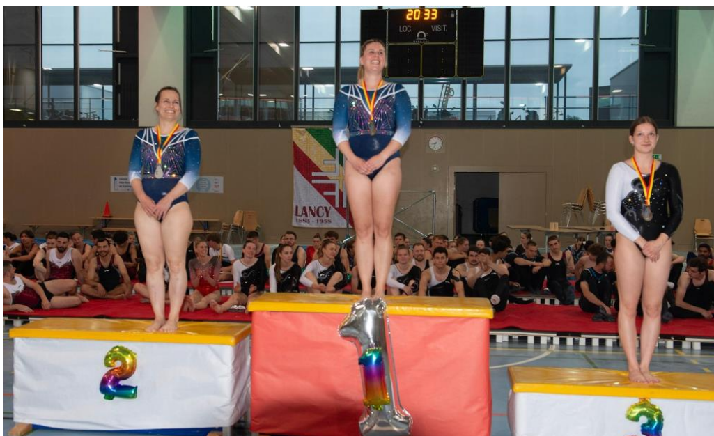
Podium catégorie Dames