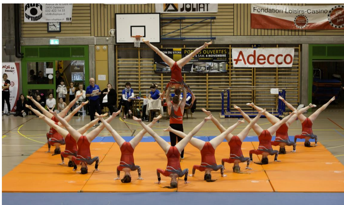
Gymnastes du Groupe Sportif Courchapoix - Les Warriors (catégorie Actifs/Actives)

Une première cette année : la possibilité de faire une production en petite équipe (3 à 5 gymnastes), qu'un groupe a expérimentée. Deux sociétés invitées ont pris part à l'exercice (FSG Malleray-Bévilard en Cracks et FSG Perrefitte en Actifs/Actives). Concernant le classement, « Les Guerrières » de Sport-Gym Courtételle sont montées sur la plus haute marche chez les Minis. Chez les Cracks se sont « Les Crackaubar » du Groupe Sportif Courchapoix qui se sont imposés et chez les Actifs/Actives, ce sont les « Actifs Courroux » de la FSG Courroux-Courcelon.