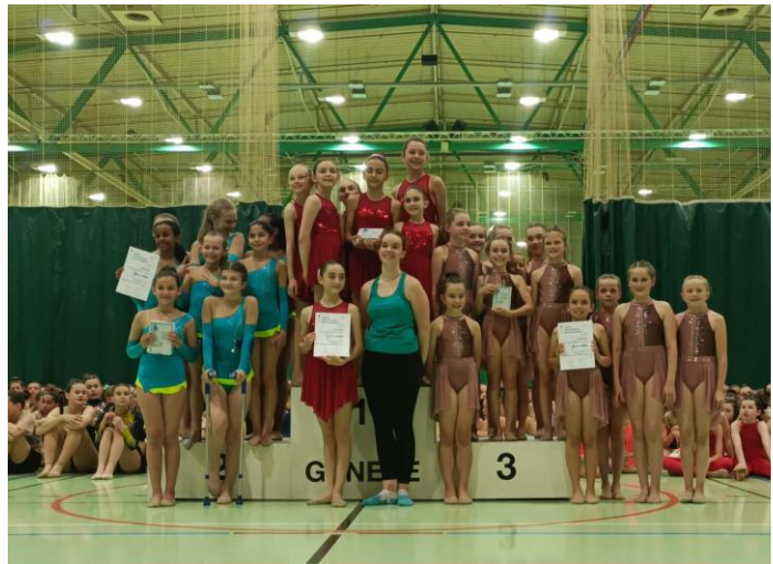
Fémina Vicques 3 e de la catégorie Jeunesse jusqu'à 12 ans

Les gymnastes de l'ACJG étaient fortement représentées lors de ces deux week-ends de compétitions de la Fête romande en Gym&Danse. Les parents et amis jurassiens étaient également très nombreux dans le public. C'était magnifique ! Des moments forts en émotions garantis !