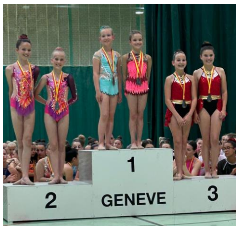
Podium gym à deux - jusqu'à 12 ans