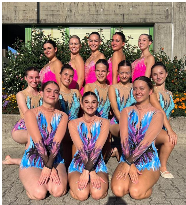
En haut : team Active - FSG Courroux-Courcelon Au milieu : team Jeunesse - FSG Courroux-Courcelon A genoux : team Active - Fémina-Club Develier

Tous les résultats : https://dqxy.link/cs-gym2024